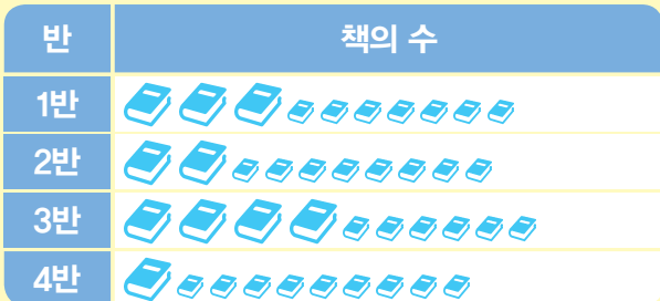
반별 빌려간 책의 수

자료를 표로 나타내니 합계를 알기 쉽고 그림그래프로 나타내니 자료를 한눈에 비교하기 쉬워요!!